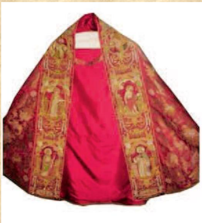
- PLUVIJAL, 1663.GOD ZAGREB