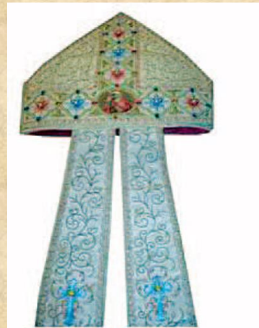
- MITRA OKO 1900. GOD. RAD SESTARA MILOSRDNICA