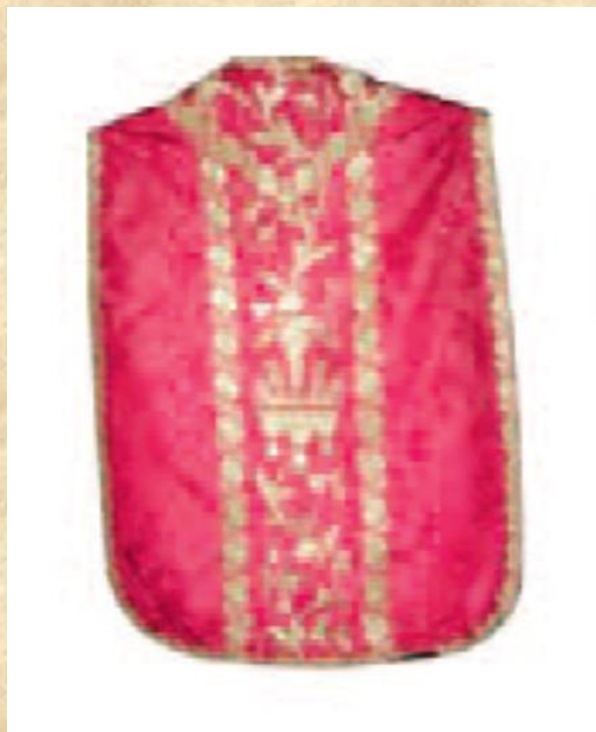
- MISNICA, KRAJ 18.ST. DAO IZRADITI BISKUP HRVATSKA